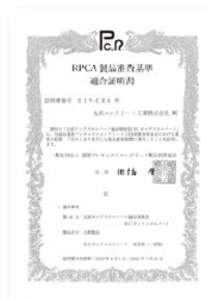
(一社) 道路プレキャストコンクリート 製品技術協会