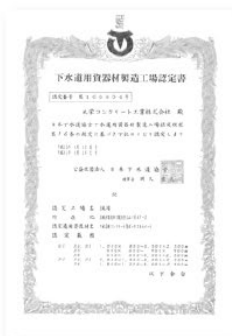
(公社) 日本下水道協会