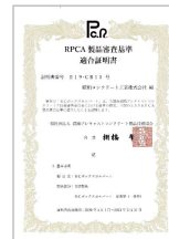
【RPCA製品審査基準適合証明書】 I19-WK16号